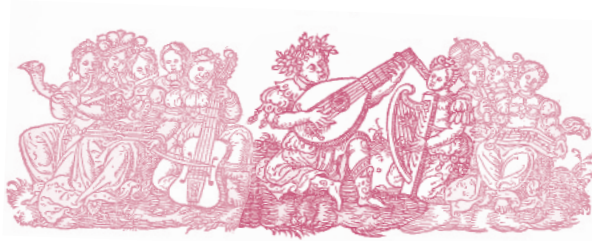
Hortus musarum, Louvain, Pierre Phalèse, 1552