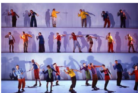
Les Paladins

Trois opéras et une conférence liminaire