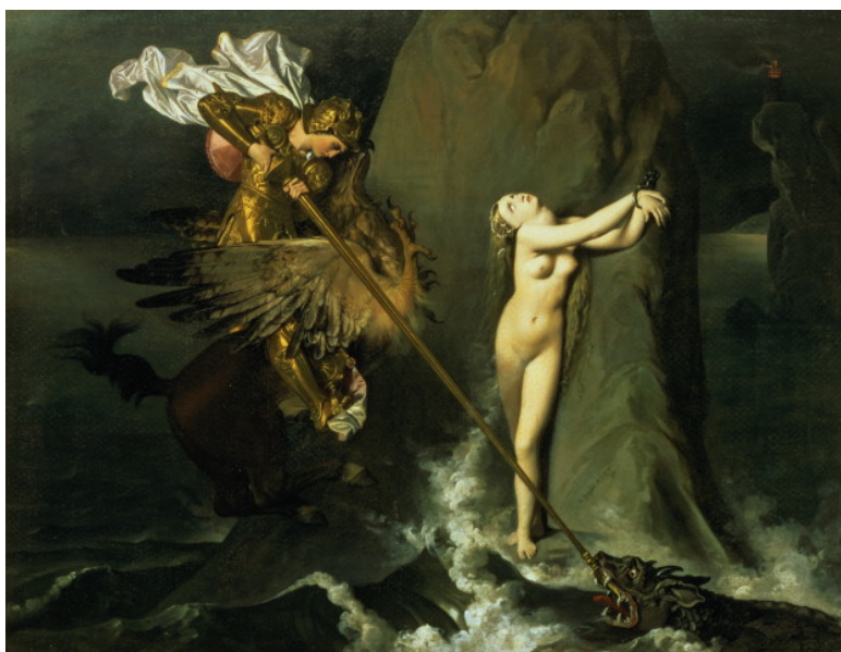
Jean-Auguste-Dominique Ingres (Montauban, 1780 - Paris, 1867), Roger délivrant Angélique , 1819, huile sur toile, musée du Louvre, département des Peintures