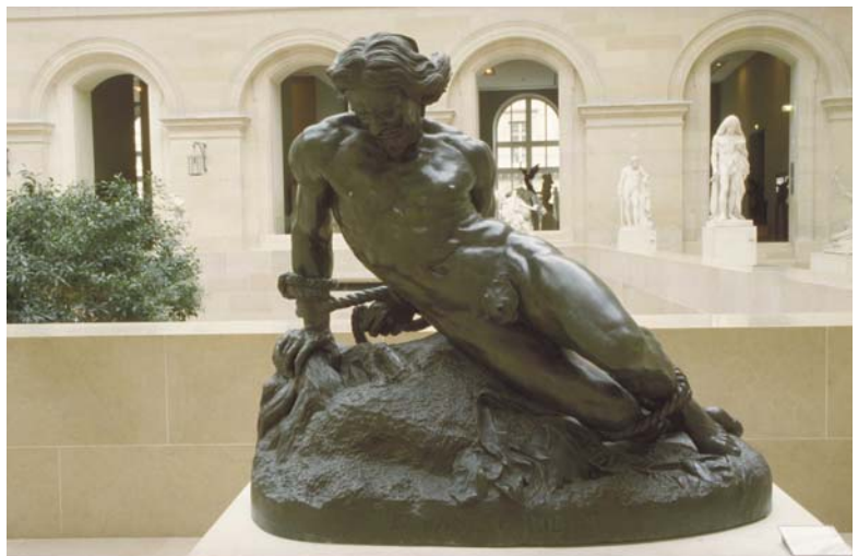
Jean-Bernard Duseigneur, dit Jehan, Roland furieux , musée du Louvre © Musée du Louvre / Pierre Philibert.

Stefano Accorsi, acteur italien découvert en France notamment grâce à la Chambre du fils de Nani Moretti ou bien Romanzo Criminale , viendra nous lire un montage de textes extraits d' Orlando furioso ( Roland furieux ) dans la langue originale. Un grand moment de poésie et de musique du langage.