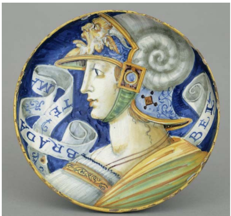
Coupe, Guerrier casqué en buste de profil à gauche, "Bradamante", vers 1525-1530, faïence, Italie, musée national de la Céramique de Sèvres