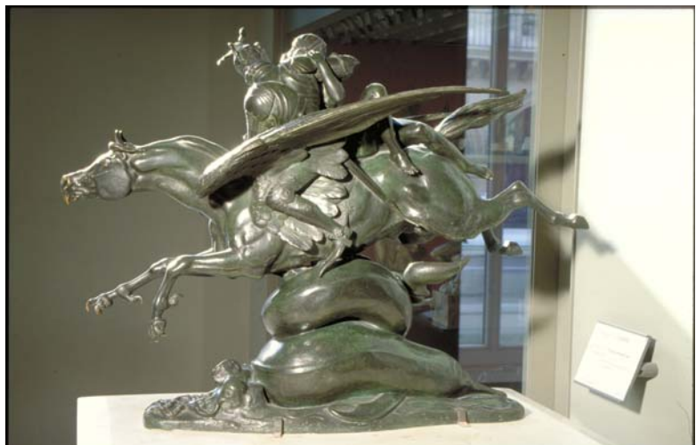
Antoine-Louis Barye, Angélique et Roger montés sur l'hippogriffe, vers 1840, musée du Louvre

Le sculpteur Barye relate dans le bronze, avec fougue et virtuosité, l'épisode du chant X de Roland furieux , dans lequel Roger, après avoir délivré Angélique d'un monstre marin, l'enlève sur sa monture.