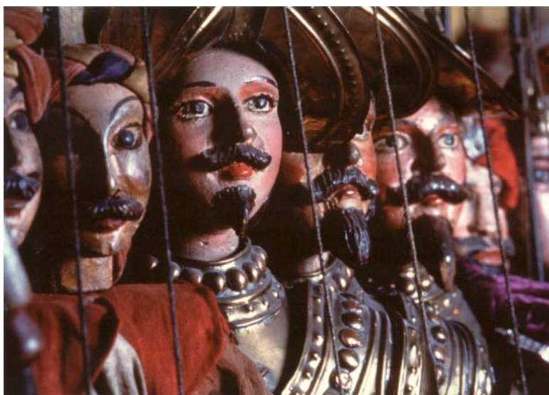
Pupi siciliani

Héritier de cette tradition, Mimmo Cuticchio propose une libre interprétation de Roland amoureux de Matteo Maria Boiardo et de Roland furieux de l'Arioste, mêlant avec audace improvisation narrative, musique, manipulation à vue des « Pupi » et clins d'œil aux ingrédients incontournables de l'opéra dei Pupi : aventures, combats, magie, amour, héroïsme... Créé à la Biennale de Venise, ce spectacle témoigne de la recherche innovante engagée par la compagnie palermitaine pour faire dialoguer art populaire et création, et participer ainsi activement à la sauvegarde d'une tradition menacée, en dépit de son classement en 2001 par l'UNESCO parmi les « Chef-d'œuvres du patrimoine oral et immatériel de l'humanité ».