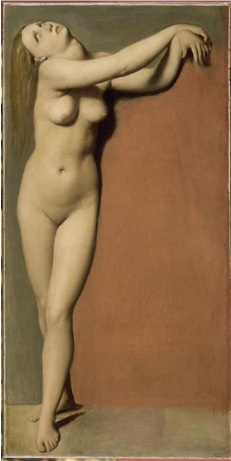
Jean-Auguste-Dominique Ingres, Angélique, étude pour Roger délivrant Angélique , 1819, musée du Louvre © RMN / Droits réservés.