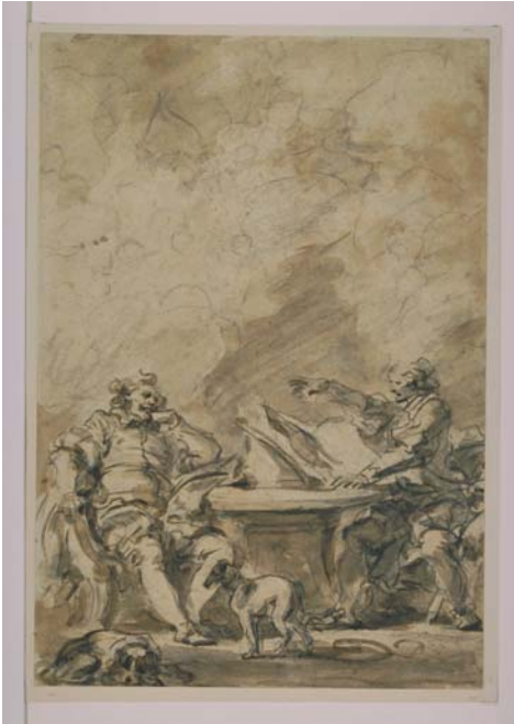
Jean-Honoré Fragonard, L'Arioste dédie son poème à Hippolyte d'Este , vers 1780, musée du Louvre, département des Arts graphiques © Musée du Louvre.

Onze dessins de Jean-Honoré Fragonard (1732-1806) d'après Roland furieux sont présentés sur la scène de l'auditorium. Par-delà les siècles qui les séparent, un dialogue s'établit entre les deux artistes qu'un même goût pour l'épopée et le merveilleux réunit. Rivalisant avec l'Arioste, Fragonard se fait à son tour conteur pour captiver le lecteur et lui faire partager ces aventures fantastiques et en même temps profondément humaines.