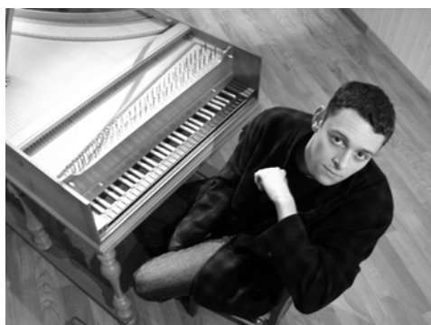
Benjamin Alard © D.R

Table ronde - Une mémoire retrouvée : 1969, Orlando furioso mis en scène par Luca Ronconi avec Luca Ronconi (sous réserve), metteur en scène, Colette Godard, ancienne critique du Monde , Martine Kahane, CNCS, Moulins, Franco Quadri, critique dramatique de La Repubblica